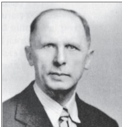
Charles Franklin Schnabel Părintele ierbii de grâu

6,8 kilograme de iarbă de grâu au valoarea nutrițională totală a 159 de kilograme de legume obișnuite din grădină. Știm în continuare foarte puține lucruri despre ceea ce poate însemna iarba pentru om în viitor. 1